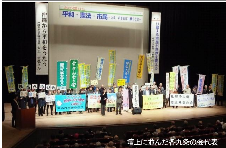
壇上に並んだ各九条の会代表

各「九条の会」の代表が壇上に並んで開会の挨拶を受けた後、八重山民謡第一人者の大工